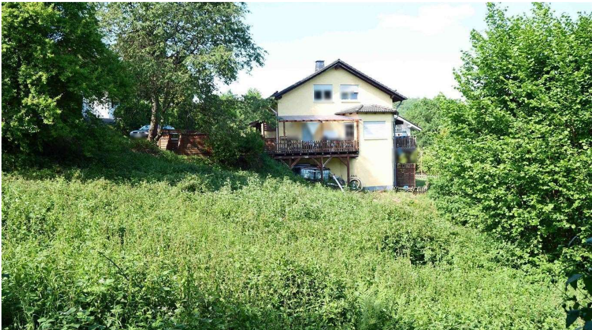
mögliche Bebauung: siehe Nachbarhaus