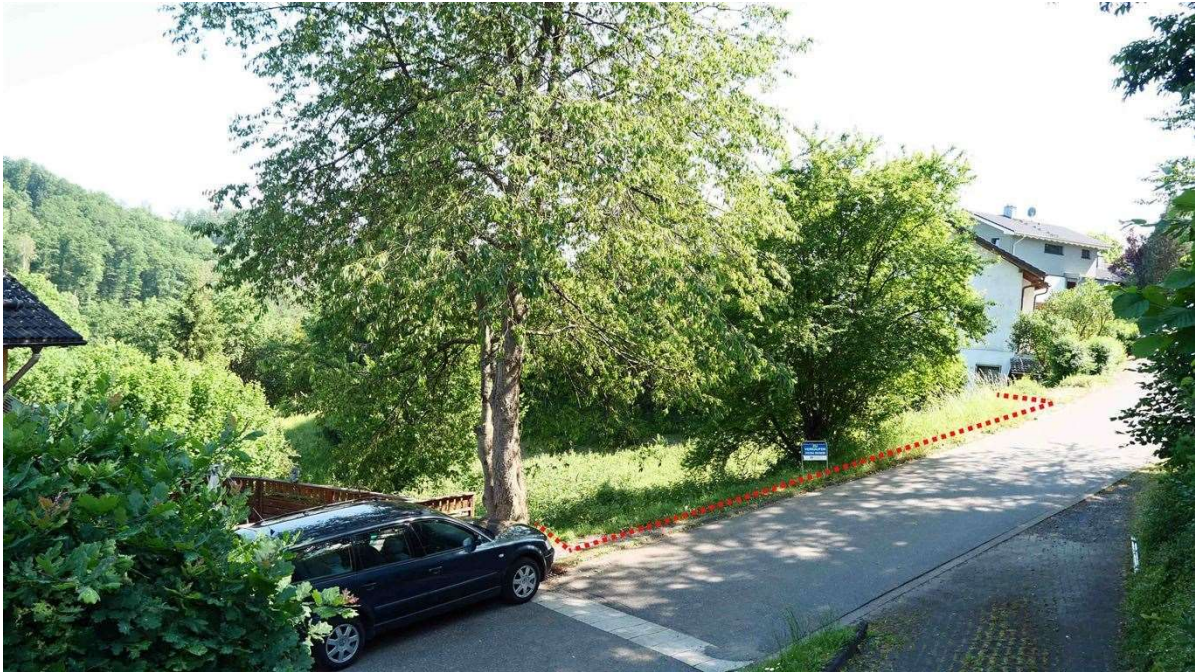
in einer grünen, verkehrsberuhigten Straße gelegen