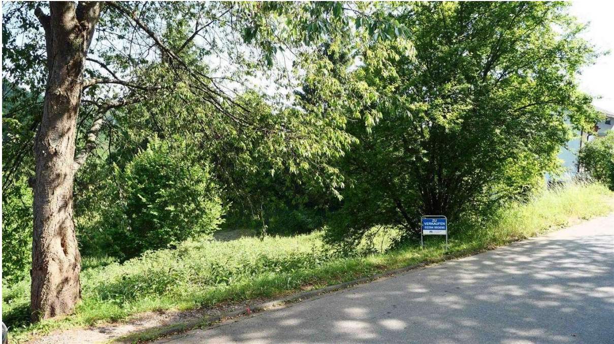
1.128 m 2 großes Grundstück in Naturlage für 50.000 €