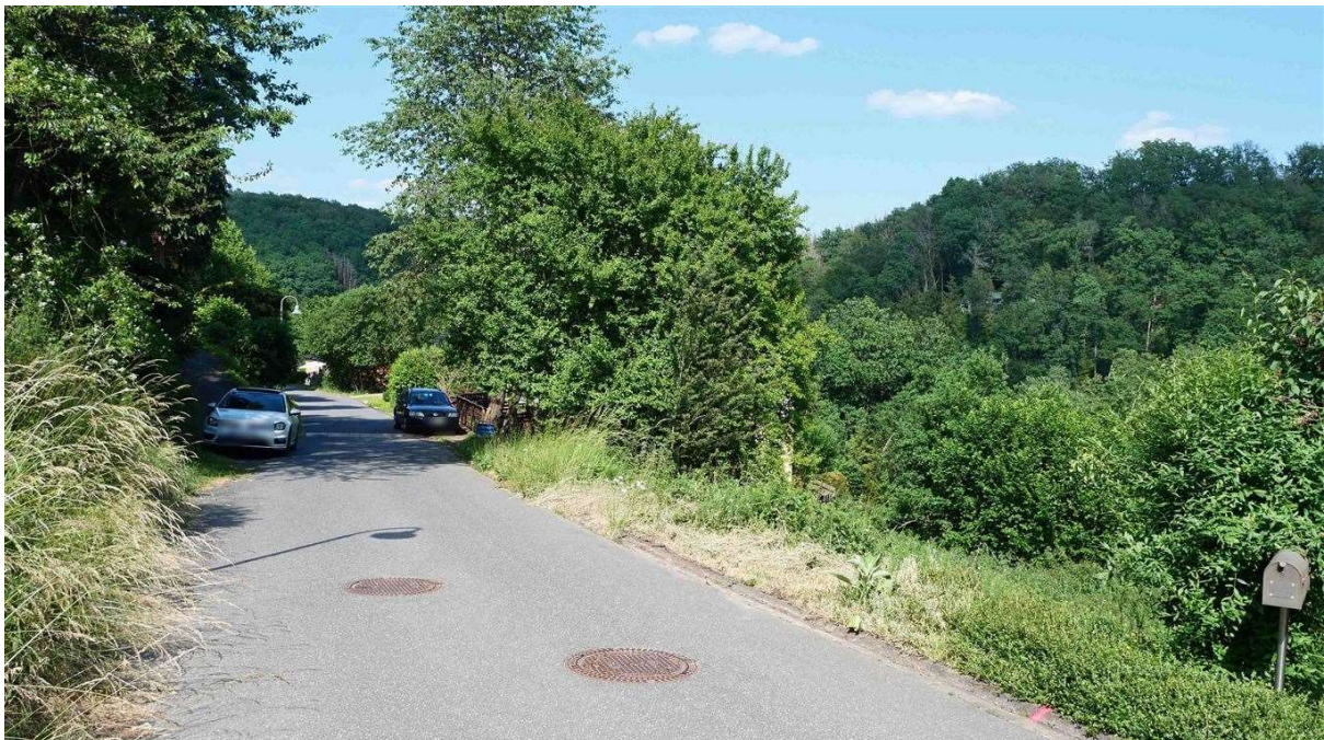
voll erschlossen und sofort bebaubar